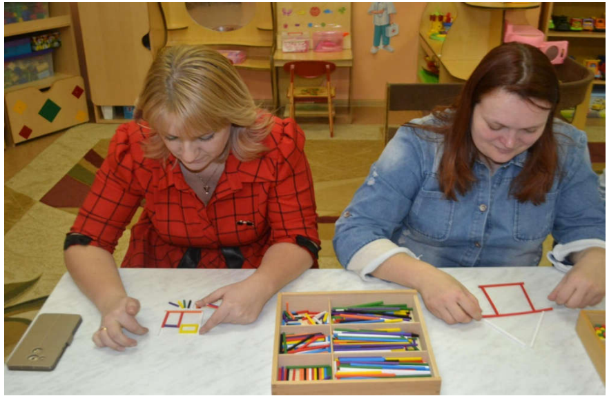
Мастер – класс с педагогами: «Авторские игры «Эйдо – рацио минутки» с применением пособия « Дары Фрёбеля»